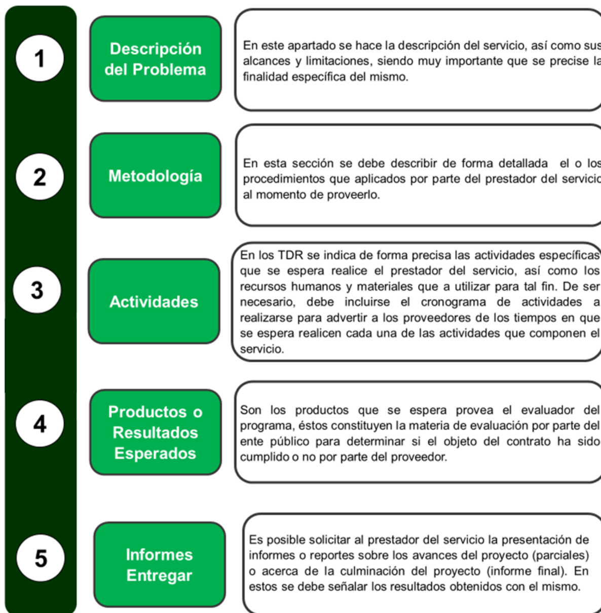
Figura 1. Apartados de los Términos de Referencia